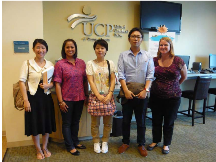
UCP (United Cerebral Palsy)

子供の脳性マヒの施設では世界的に有名。アメリカでは大統領を始めとして、著名人が寄付者やボードメンバーとして名前を連ねる。案内をしてくれたセラピストのLisaマネージャーと