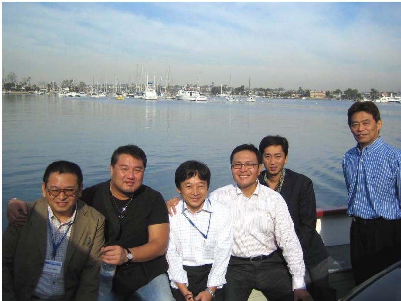
Newport Beach (ダイニチ)