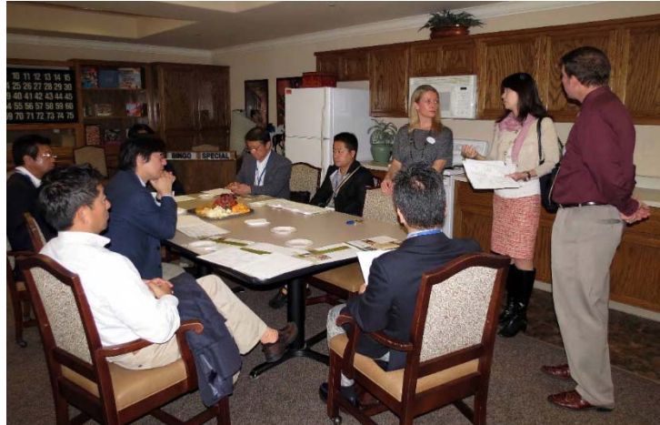
Oakmont介護施設 でのディスカッション