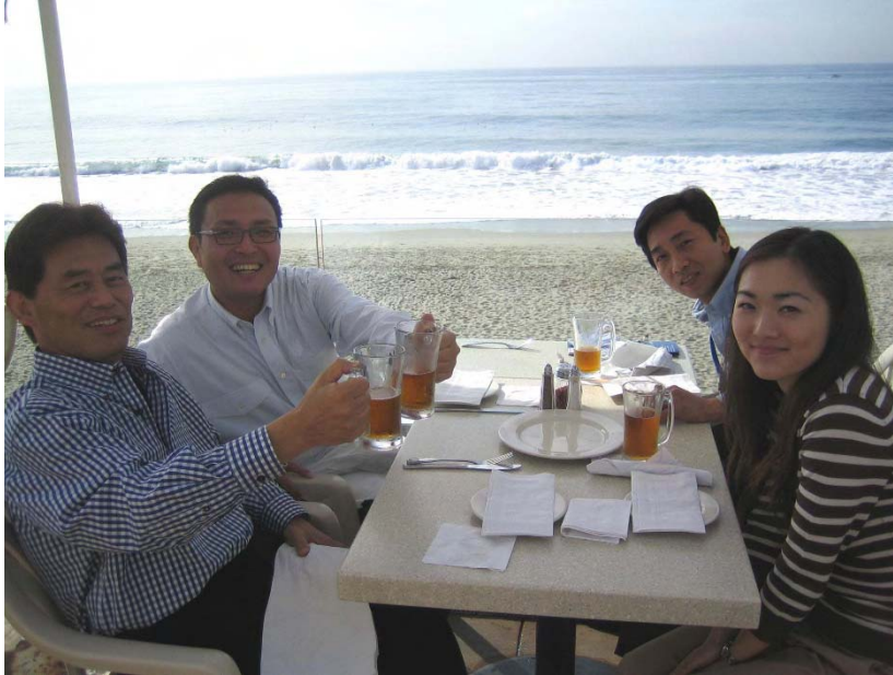
Laguna Beach (ダイニチ)