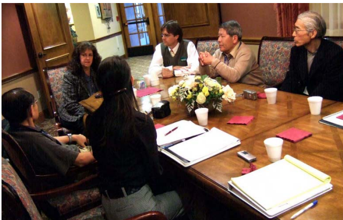
介護施設 での質疑応答