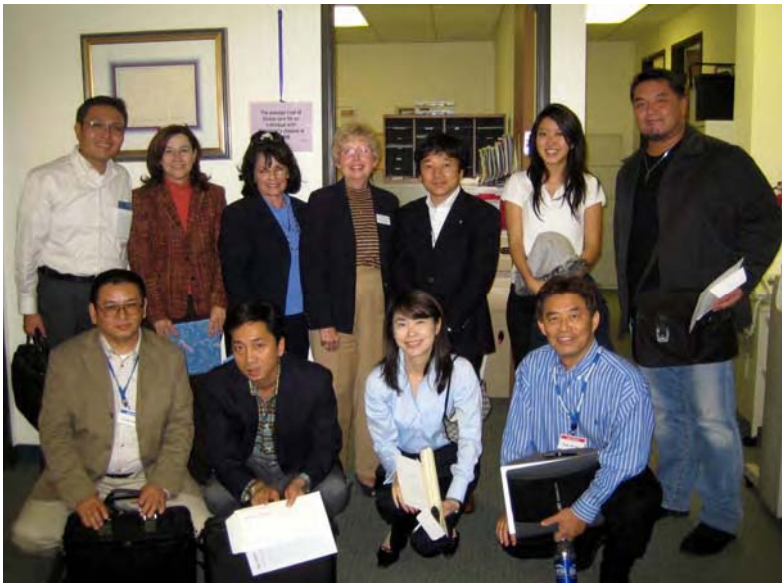
米国アルツハイマー協会 (ダイニチ)