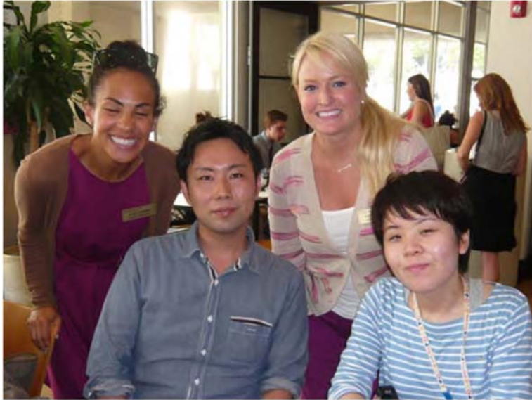
作業療法プログラム修士課程2年生の学生と質疑応答