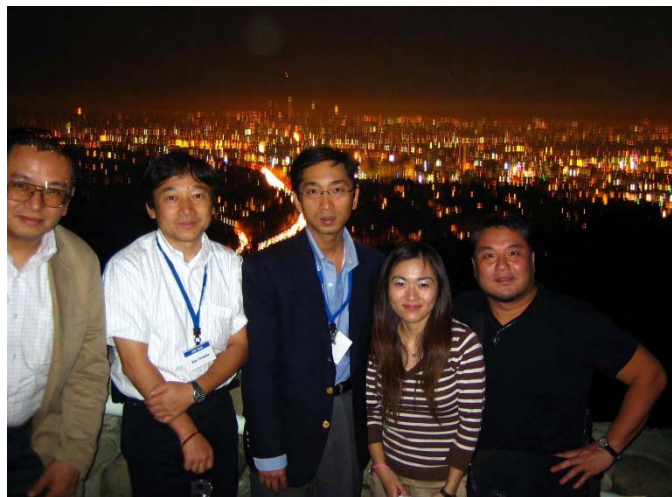
ロサンジェルの夜景 （ダイニチ）