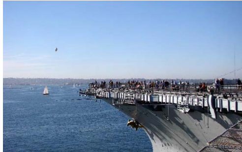
USS Midway Aircraft Carrier Museum サンディエゴ空母博物館