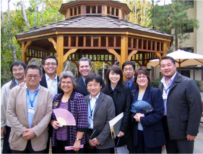
Cypress CT. 介護施設 (ダイニチ)