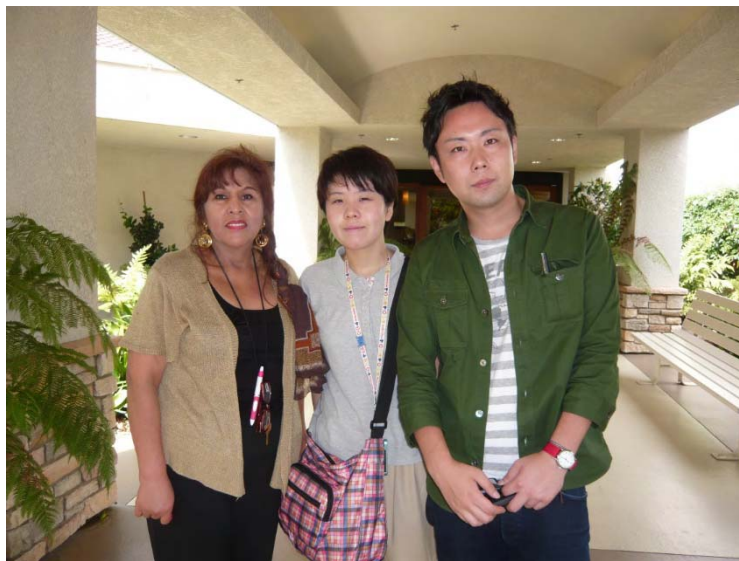
Regent Points 介護施設訪問

子供の脳性マヒの施設では世界的に有名。アメリカでは大統領を始めとして、著名人が寄付者やボードメンバーとして名前を連ねる。案内をしてくれたセラピストのLisaマネージャーと