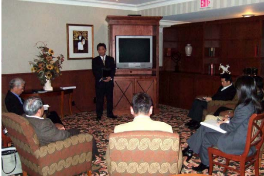
IGEによるオリエンテーション (介護施設経営者)