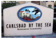
太平洋に面したラグヤリー介護施設 Independent, Assisted, Nursing