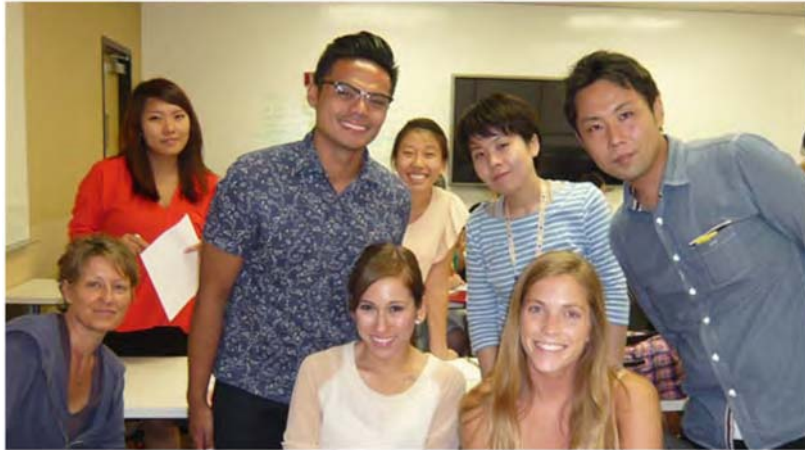
小児作業療法の実験室の様子：隣の部屋から実際の作業療法の風景を見学できる様になっている。