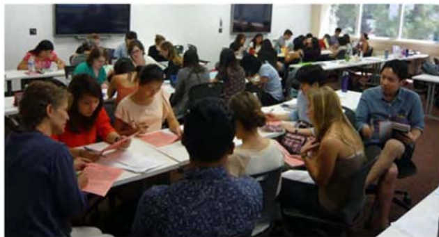
授業見学と グループディスカッションに参加