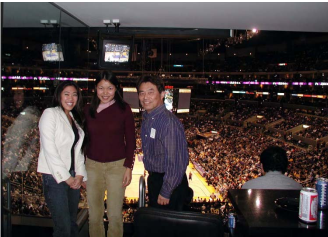
VIP ルームで LA Lakersの試合を観戦 (ダイニチ)