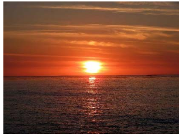
Sunset @La Jolla Beach