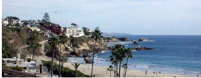
ラグーナビーチで昼食