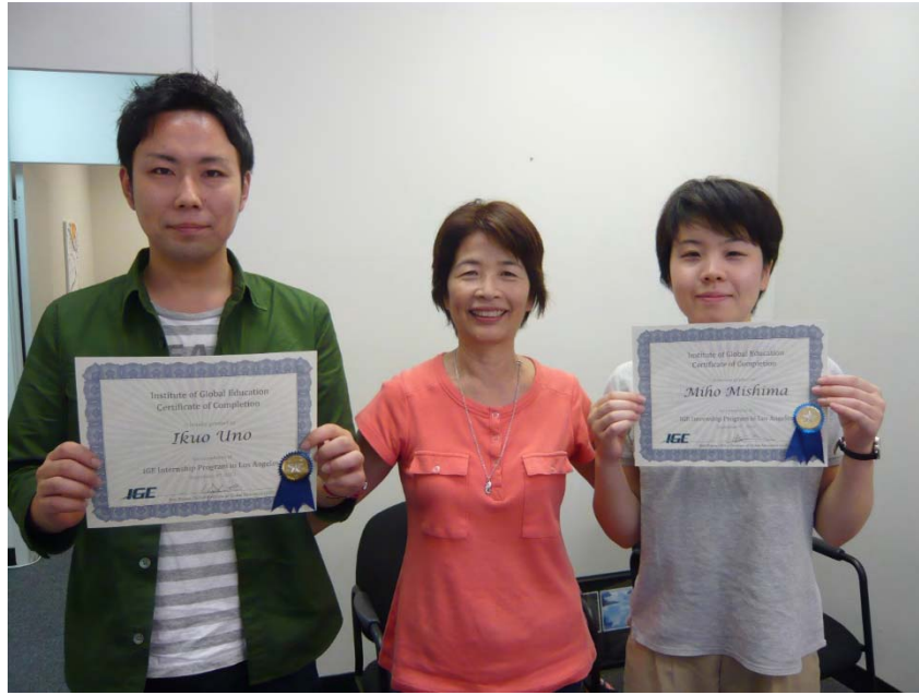
IGEから修了証を授与