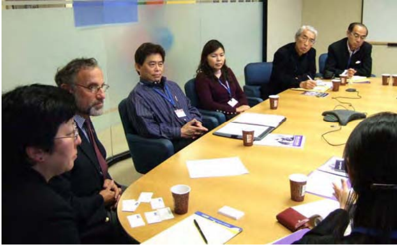
米国アルツハイマー協会にてセミナー (介護施設経営者)