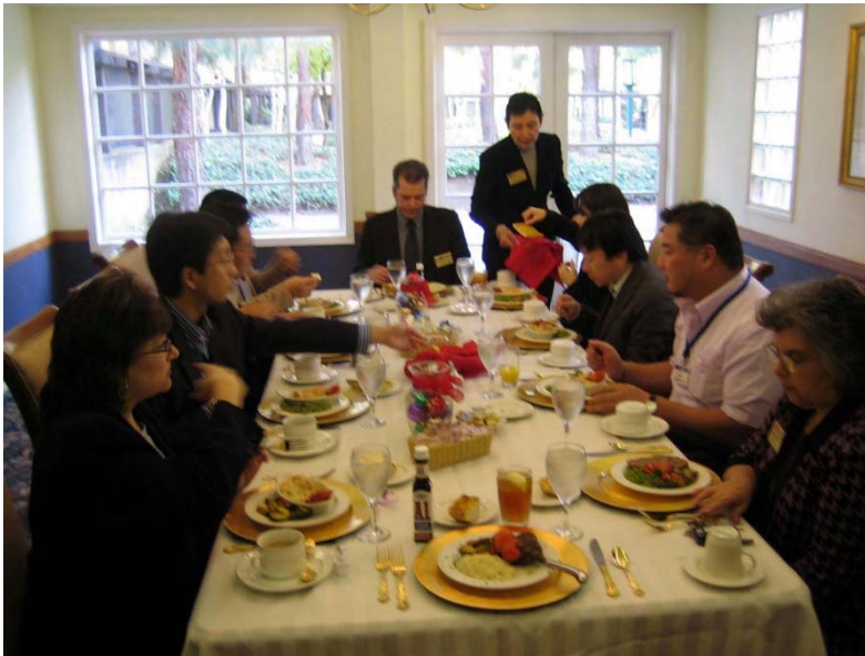
介護施設で昼食 (ダイニチ)