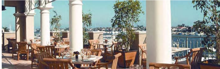
最終日の夜はNewport Beachの最高級レストラン The First Cabinでセミナーと夕食