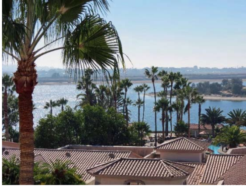
Hilton Hotel San Diego Resortの部屋から見える景色