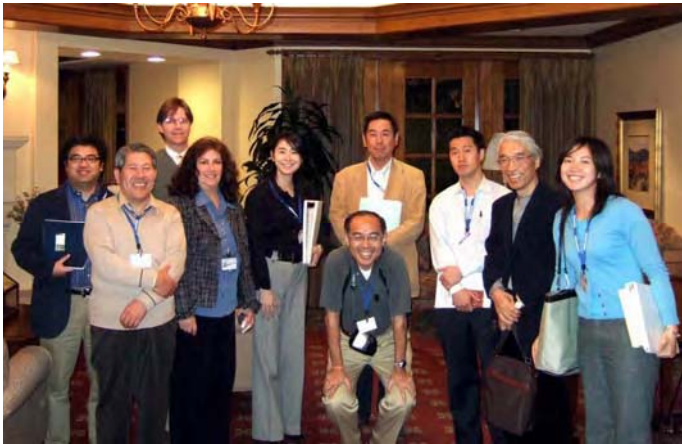
La Costa Glen介護施設