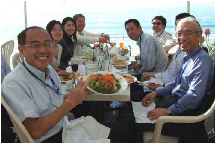
Laguna Beachで昼食 (介護施設経営者)