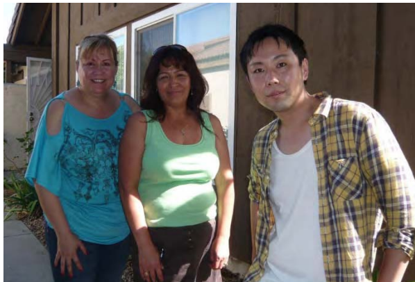
宇野君のホームステイ