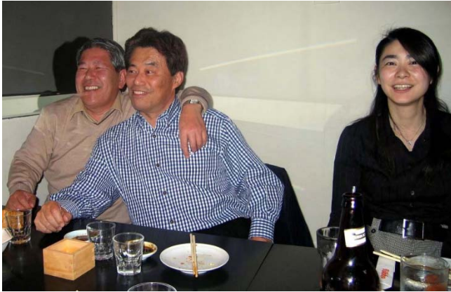
オレンジカウンティの創作日本食 レストランで懇親会 (介護施設経営者)