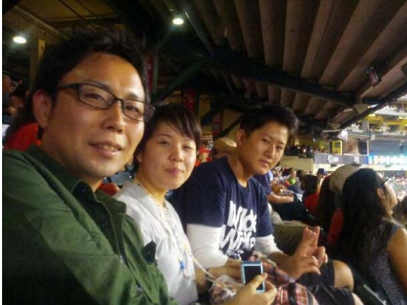
メジャーリーグ観戦 Angels - Rangers ダルビッシュが登板！