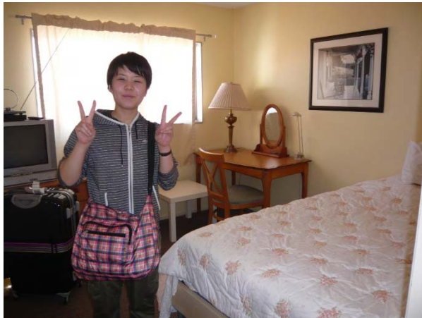
三島さんのホームステイ