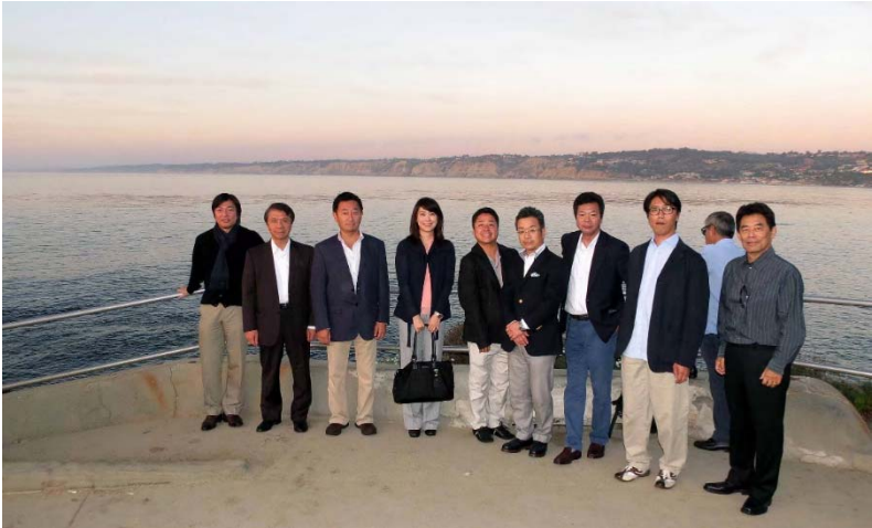
夕暮れのLa Jolla Beach