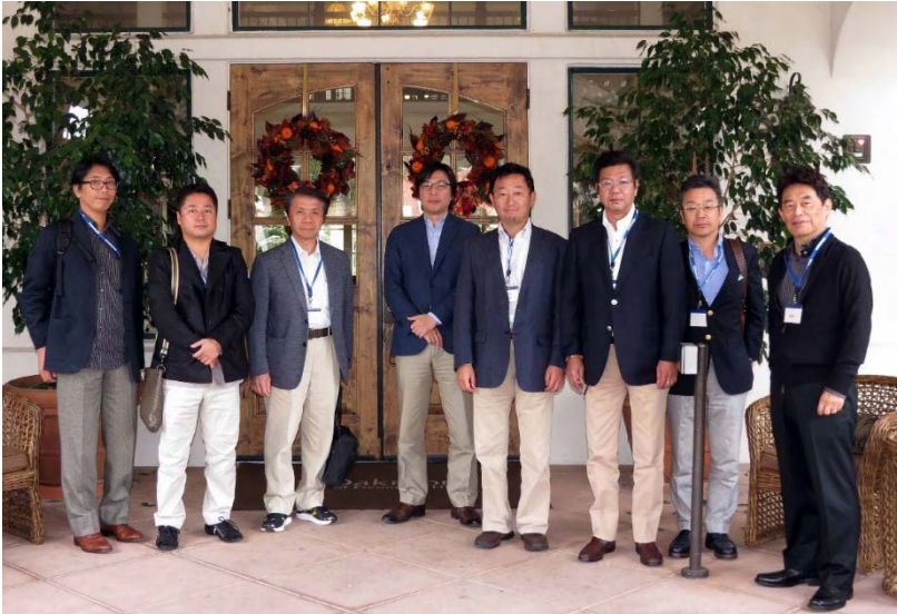
Oakmont at Escondido (CCRC) Independent, Assisted, Nursing, Dementia