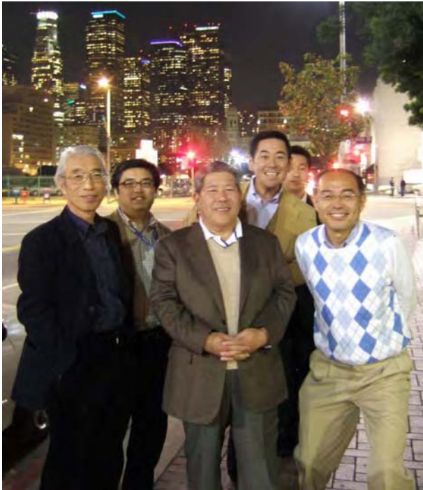
ロサンゼルス・ダウンタウンにて (介護施設経営者)