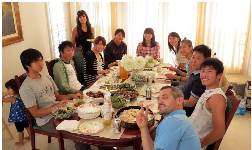
平田家でのホームパーティ 高校、大学の留學生