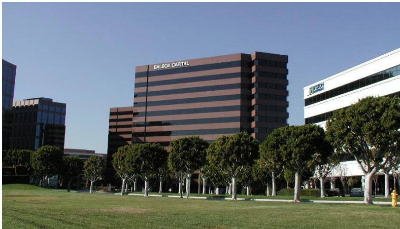
世界の一流企業が集まる Irvineのビジネス街