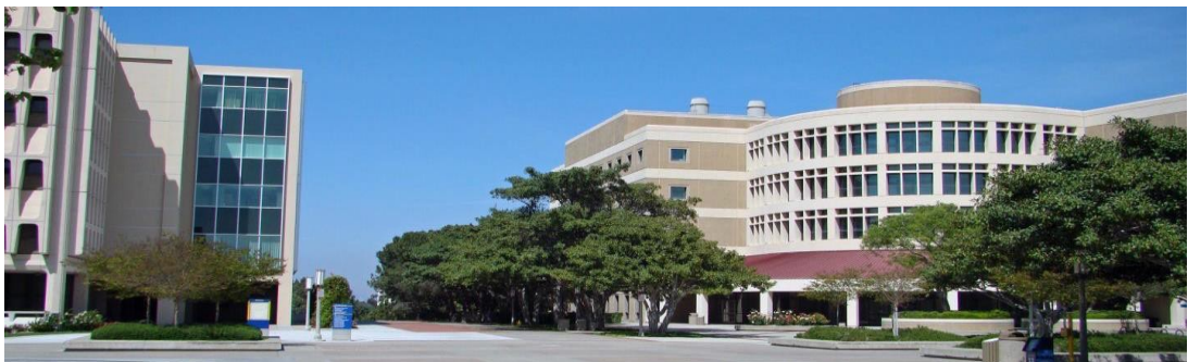
Irvineは学園都市でもあります。University of California, Irvine (UCI) カリフォルニア大学アーバイン校