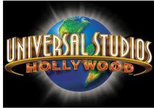
ユニバーサル・スタジオ