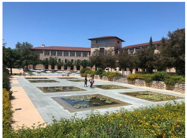
カフェテリアの前の広場