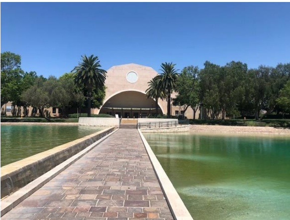
本部棟から湖を挟んで正面にあるのが Bile Campの会場の体育館