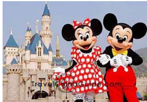
ディズニーランド