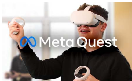
VR Design with Unity and Meta Quest 2