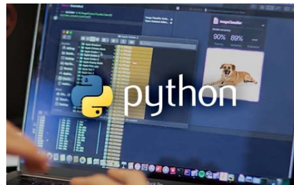
プログラミング言語